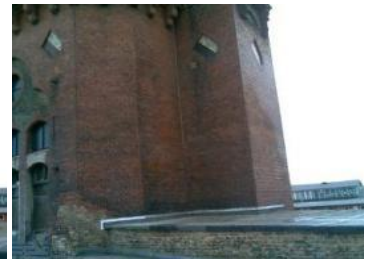
Kunde: Stadt Wiesbaden Ort: Wasserturm Schlachthof, Wiesbaden Leistung: Graffitientfernung