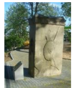
Kunde: Landeshauptstadt Wiesbaden Ort: Schulberg, Grabmal und Infotafel Leistung: Graffitientfernung, Reinigung, Schutz