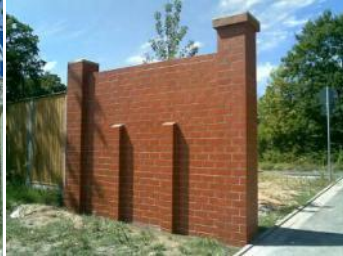
Kunde: Baugemeinschaft – Friedrichsdorf Ort: Lärmschutzwand, Friedrichsdorf Leistung: Graffiti-Schutz