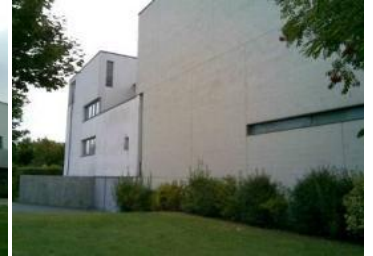
Kunde: Kirchengemeinde St. Marien Neu-Anspach Ort: Neu-Anspach Leistung: Fassadenreinigung und Graffiti-Schutz