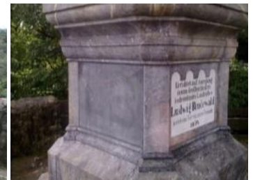
Kunde: Gemeinde Villmar Ort: Villmar, Denkmal Leistung: Graffitientfernung, Reinigung, Graffiti-Schutz