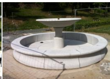
Kunde: Magistrat der Stadt Usingen Ort: Schlossgarten, Brunnen Leistung: Graffiti-Schutz