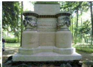
Kunde: Landeshauptstadt Wiesbaden Ort: Alter Friedhof, verschiedene Denkmäler Leistung: Graffitientfernung, Reinigung, Schutz