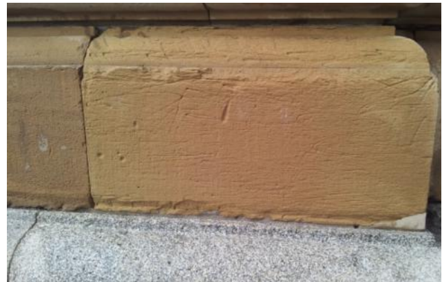
Nachher – mit Semi-Permanentschutz