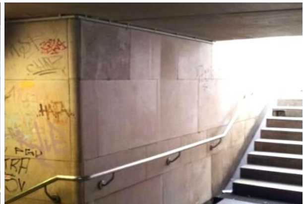
Nachher - Permanentschutzlack aufgebracht