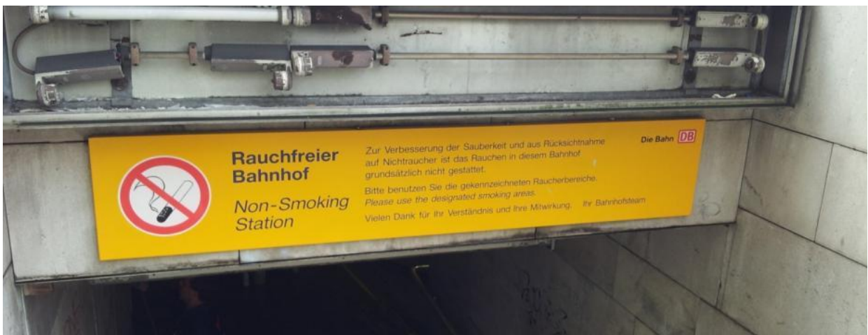
Nachher – Permanentschutzlack aufgebracht