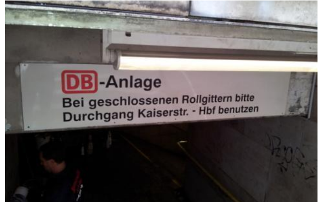
Nachher – Permanentschutzlack aufgebracht