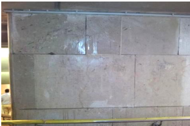
Farbschatten zu 98 % entfernt