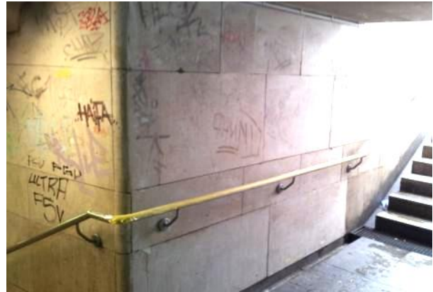
Farbschatten nach Graffiti-Entfernung