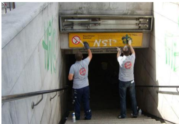
Graffiti-Entfernung ohne Schäden an Untergrund [Lack/Schrift]