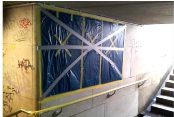
Abkleben / Einwirkzeit ca. 24 Stunden