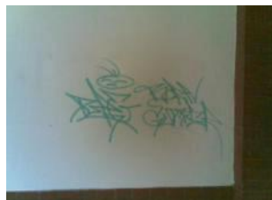
3. Reinigung – 04/2010

Einfache Graffiti-Entfernung von permanent geschützten Flächen