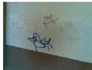
4. Reinigung – 08/2010