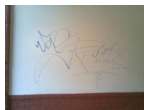
6. Reinigung – 05/2011