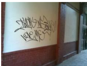
1. Reinigung – 08/2009