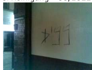
8. Reinigung – 08/2012