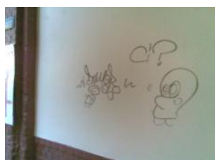
5. Reinigung – 03/2011