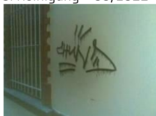
7. Reinigung – 12/2011