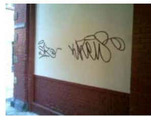
2. Reinigung – 09/2009